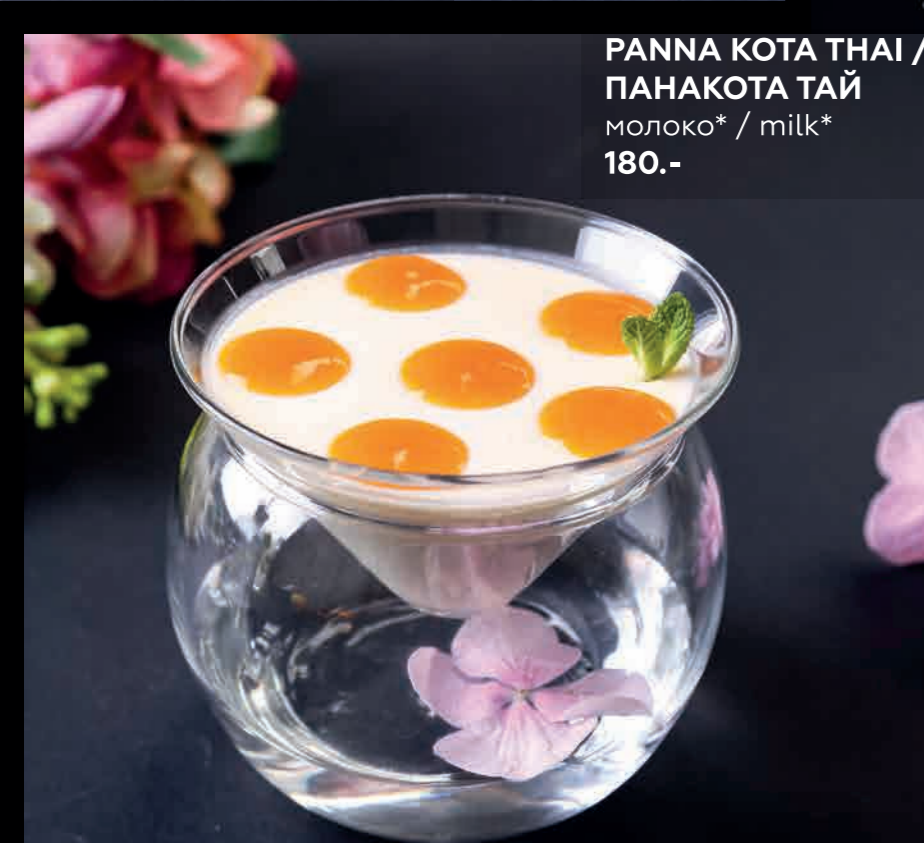
ПАНА КОТА ТАИ / ПАНАКОТА ТАЙ молоко* / milk* 180.-