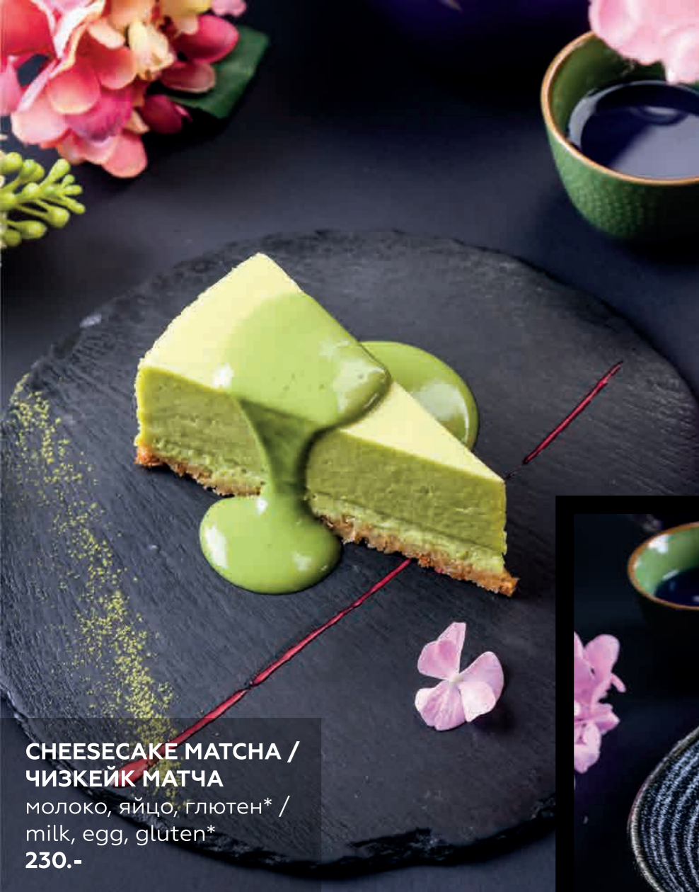
CHEESECAKE MATCHA / ЧИЗКЕЙК МАТЧА молоко, яйцо, глютен* / milk, egg, gluten* 230.-