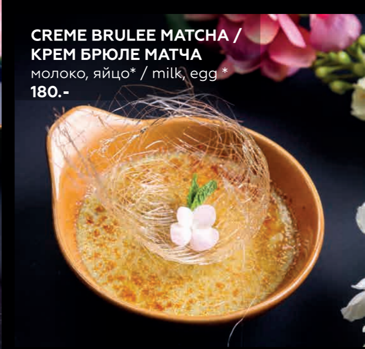
CREME BRULEE MATCHA / КРЕМ БРЮЛЕ МАТЧА молоко, яйцо* / milk, egg* 180.-