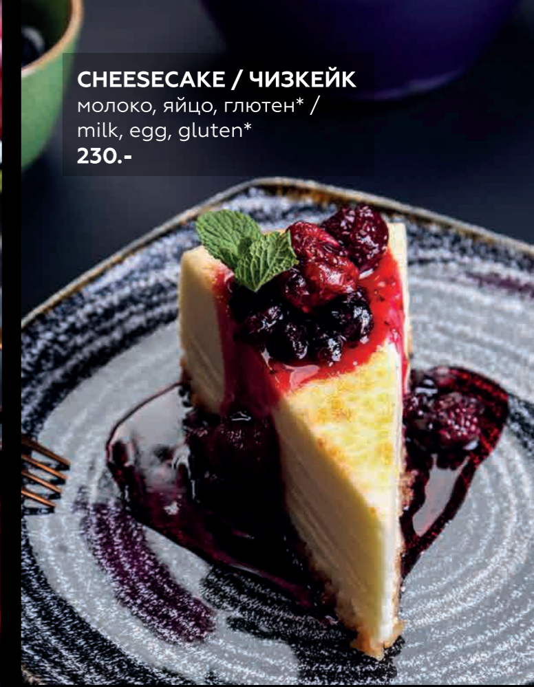
CHEESECAKE / ЧИЗКЕЙК молоко, яйцо, глютен* / milk, egg, gluten* 230.-