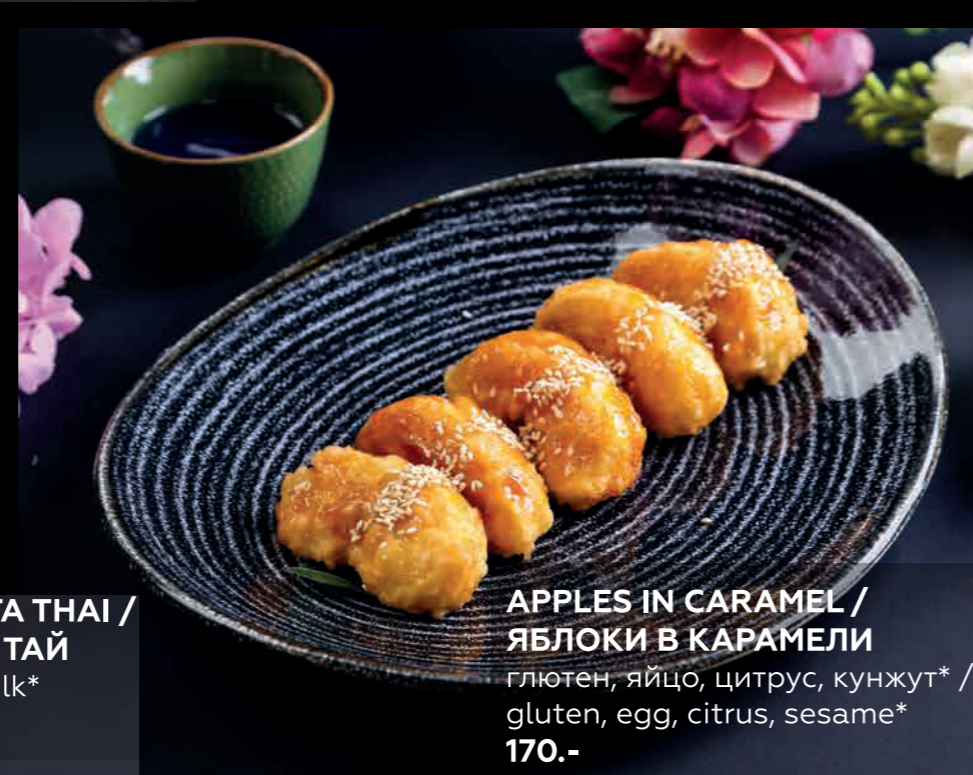
APPLES IN CARAMEL / ЯБЛОКИ В КАРАМЕЛИ глютен, яйцо, цитрус, кунжут* / gluten, egg, citrus, sesame* 170.-