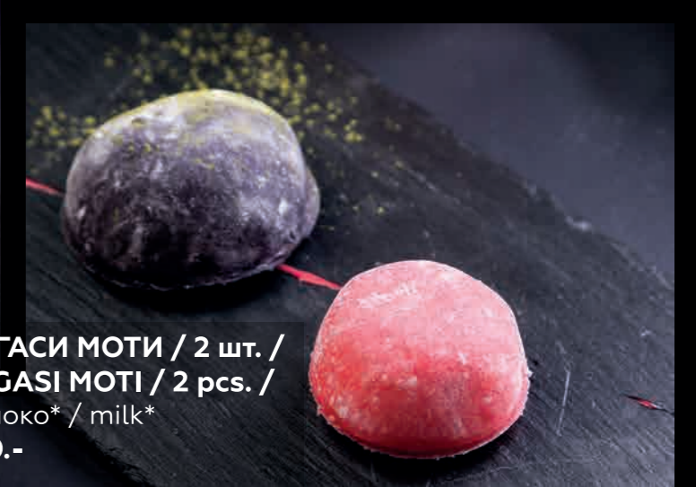
ВАГАСИ МОТИ / 2 шт. / VAGASI MOTI / 2 pcs. / молоко* / milk* 230.-