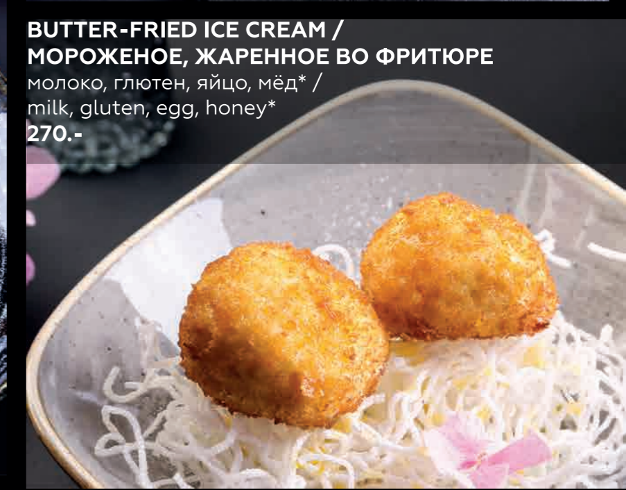
BUTTER-FRIED ICE CREAM / МОРОЖЕНОЕ, ЖАРЕННОЕ ВО ФРИТЮРЕ молоко, глютен, яйцо, мёд* / milk, gluten, egg, honey* 270.-