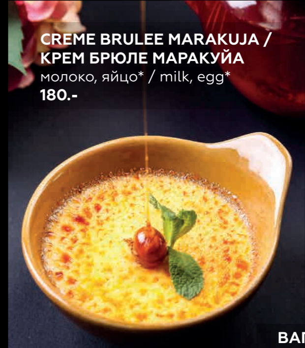
CREME BRULEE MARAKUJA / КРЕМ БРЮЛЕ МАРАКУЙА молоко, яйцо* / milk, egg* 180.-