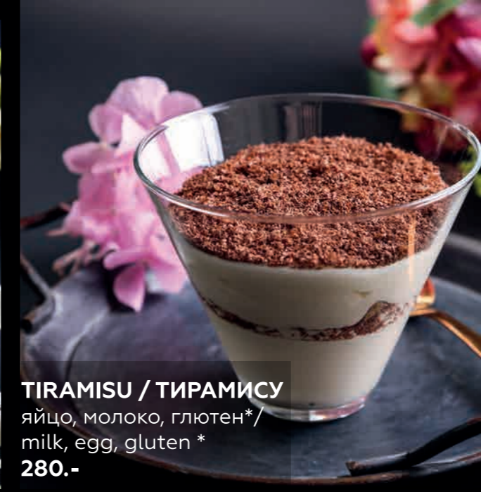
TIRAMISU / ТИРАМИСУ яйцо, молоко, глютен* / milk, egg, gluten* 280.-